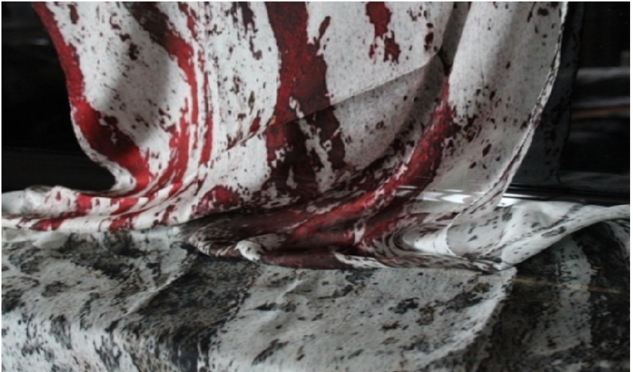
Sciarpa seta n.2 : "Nine Eleven, New York 2001" Silk Scarf # 2: "Nine Eleven, New York 2001"