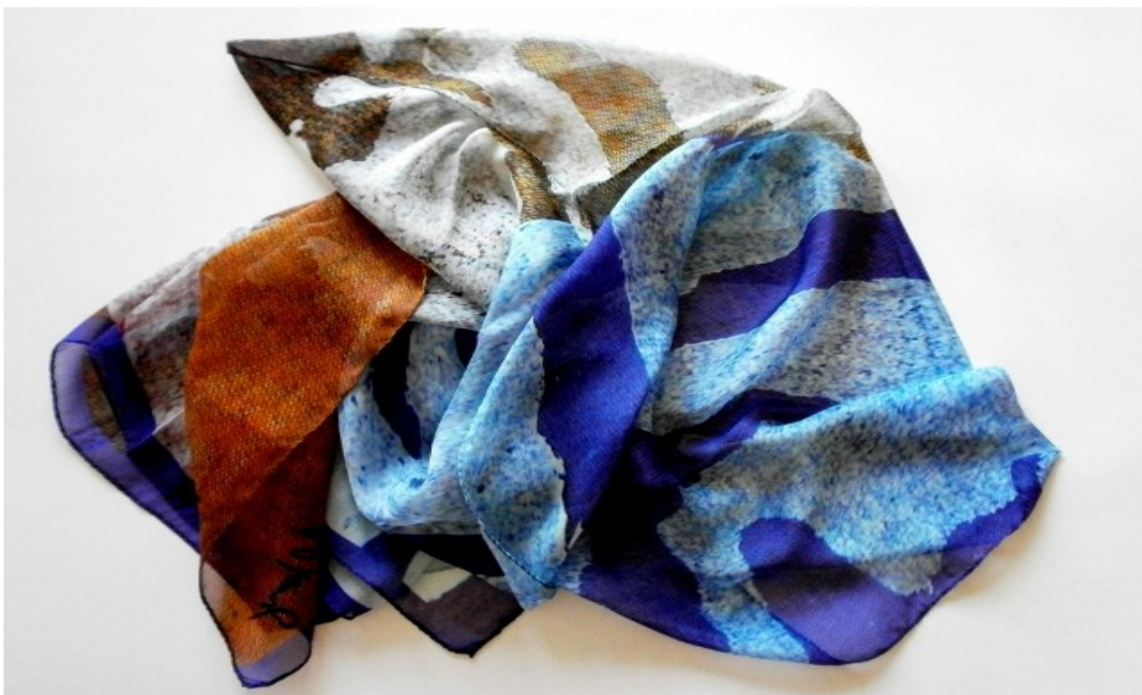
Sciarpa seta n. 1: "Stati d'animo condivisi" Silk scarf. # 1: "Shared Moods"