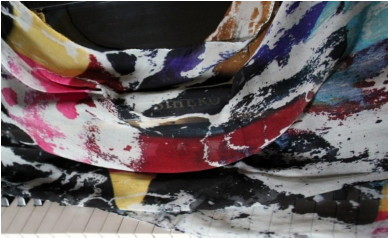
Sciarpa seta n.3 : "Vento di maggio, scompigliami i pensieri" Silk Scarf # 3: "Winds of May, ruffle my thoughts"